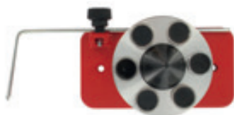
MESSERAUSWUCHT- GERÄT REF : 920-3417

Für Rasenmähermesser und Messer- scheiben für Freischneider