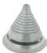
MESSERAUSWUCHT- GERÄT REF : 920-3869

Messersperre um in alle Sicherheit am Mähwerk arbeiten zu können