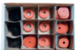
SORTIMENTKOFFER UNTERLEGSCHIEBEN REF : 921-3867

Wandbefestigung - mit 6 Magneten und Fühler