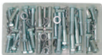
SORTIMENTKOFFER SCHRAUBEN REF : 921-6204

Sortimentskäst mit Schrauben, Keile und Scheibe, 108 Stück