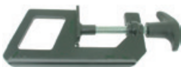
MESSERSPERRE REF : 920-3416

Messersperre um in alle Sicherheit am Mähwerk arbeiten zu können